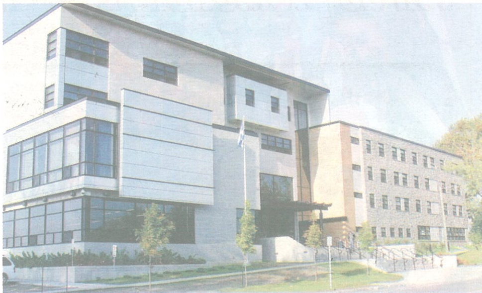
Une belle opportunité pour les cégepiennes de L'Assomption.

L'architecte impliquée dans le projet, Mireille Asselin, avait contacté le département de Design d'intérieur du Cégep régional de Lanaudière à L'Assomption pour proposer le projet aux étudiantes. Ces dernières avaient comme mandat de revoir la planification des espaces de bureaux pour plus de 60 travailleurs et bénévoles, en passant par l'espace de réception et d'accueil des bénévoles aux salles de réunion et de la cafétéria. Les propositions d'aménagement ont été réalisées dans le souci